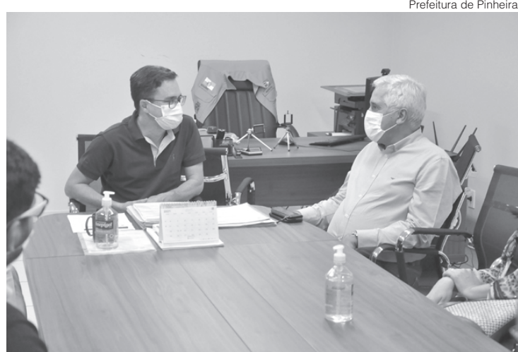
Comte e Ednardo conversam sobre educação em Pinheiral

“Entendendo que o letramento é o início do percurso escolar de toda uma geração, nós vamos oferecer com recursos próprios do Estado aos professores, que estão na turma de primeiro ano do