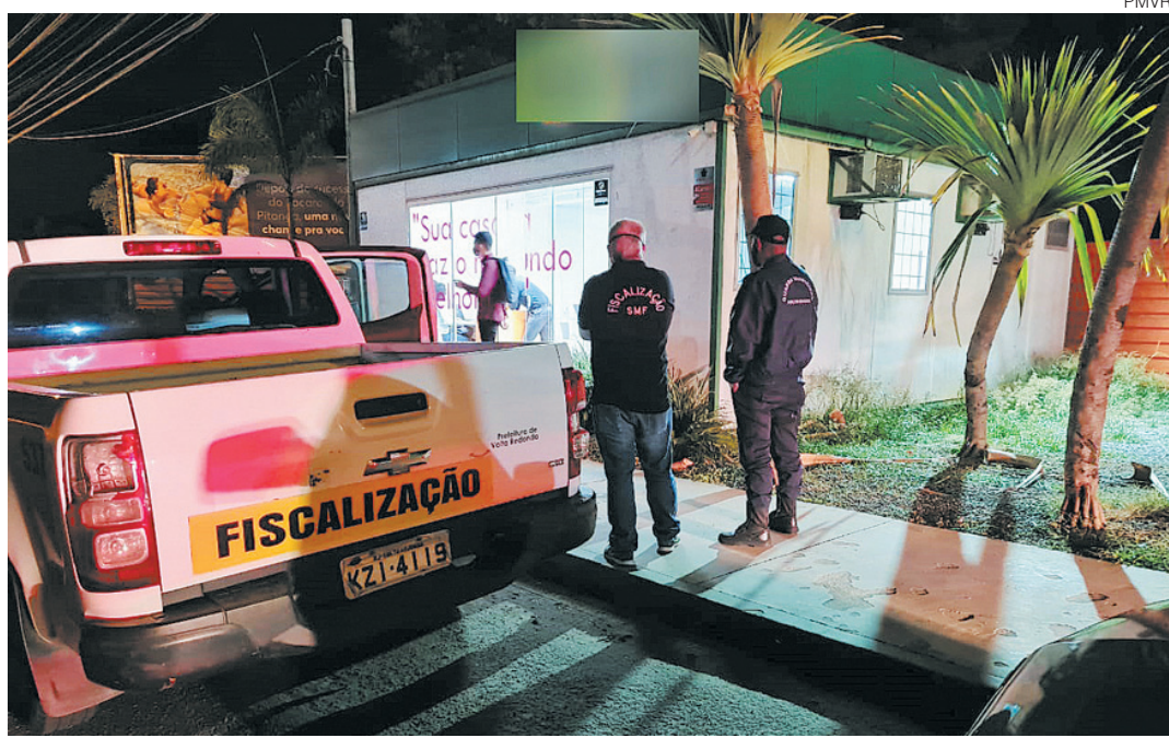
Festas com aglomerações são dispersadas em Volta Redonda