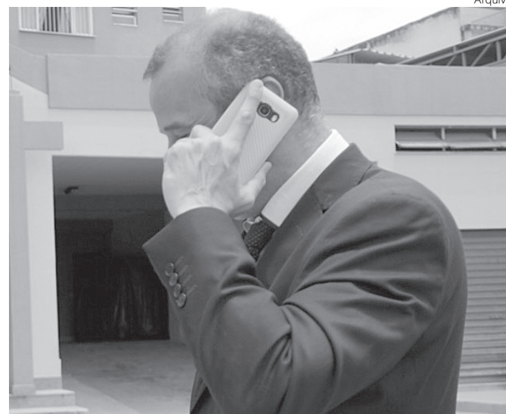
Rodrigo propõe que salários maiores tenham alíquotas mais altas que os menores; parlamentar diz que medida seria mais justa que desconto horizontal

— A Cosip foi votada em sessão extraordinária em 2017, e na época fiz uma emenda estendendo a isenção proposta de 80kw, para 200kw. E as contribuições não eram em percentual sobre a conta. No decorrer do mandato, chegando às informações prestadas pela LI-GHT, e analisando o contexto social, aumentamos a faixa de isenção da contribuição para 600kw, tendo exarado parecer favorável pelas comissões de Justiça e do Direito do Consumidor a