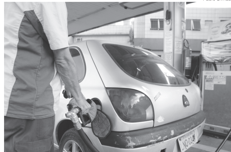
Capitais do Rio e do Acre foram as que mais apresentaram maiores preços médios em março

Por outro lado, 10 Estados registraram queda do preço médio do combustível. As maiores reduções ocorreram em Santa Cata-