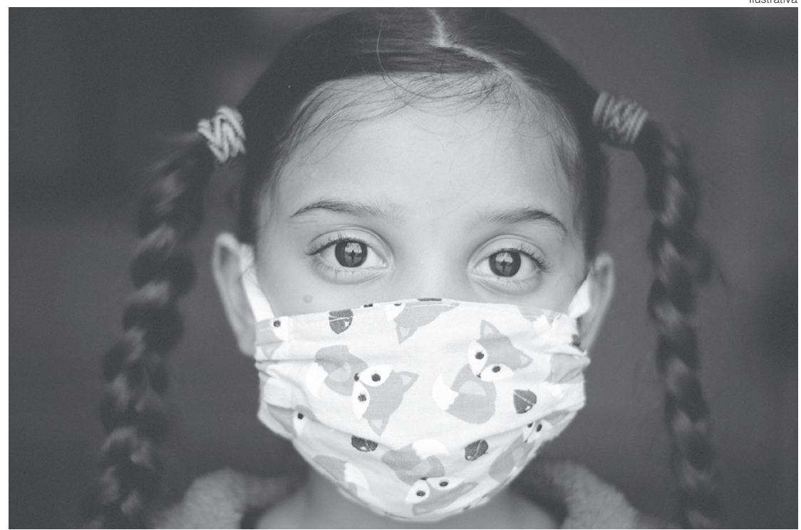
Crianças saudáveis infectadas podem ter miocardite no coração e colite

As constatações feitas por meio do estudo, no entanto, trazem evidências de que as manifestações da SIM-P são desencadeadas também pela ação direta do novo coronavírus nas células dos órgãos infectados.