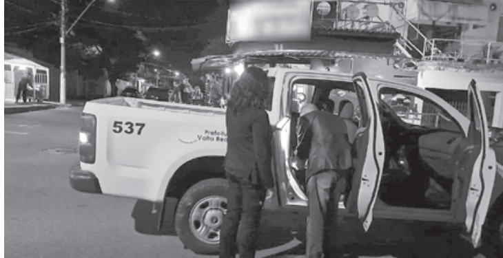
Agentes contaram com apoio da Polícia Militar e do Corpo de Bombeiros

Entre as ocorrências, na sexta-feira (30), houve a dispersão de aglomeração na praça do bairro Jardim Ponte Alta. Já no sábado, dia 1º, houve interdição de