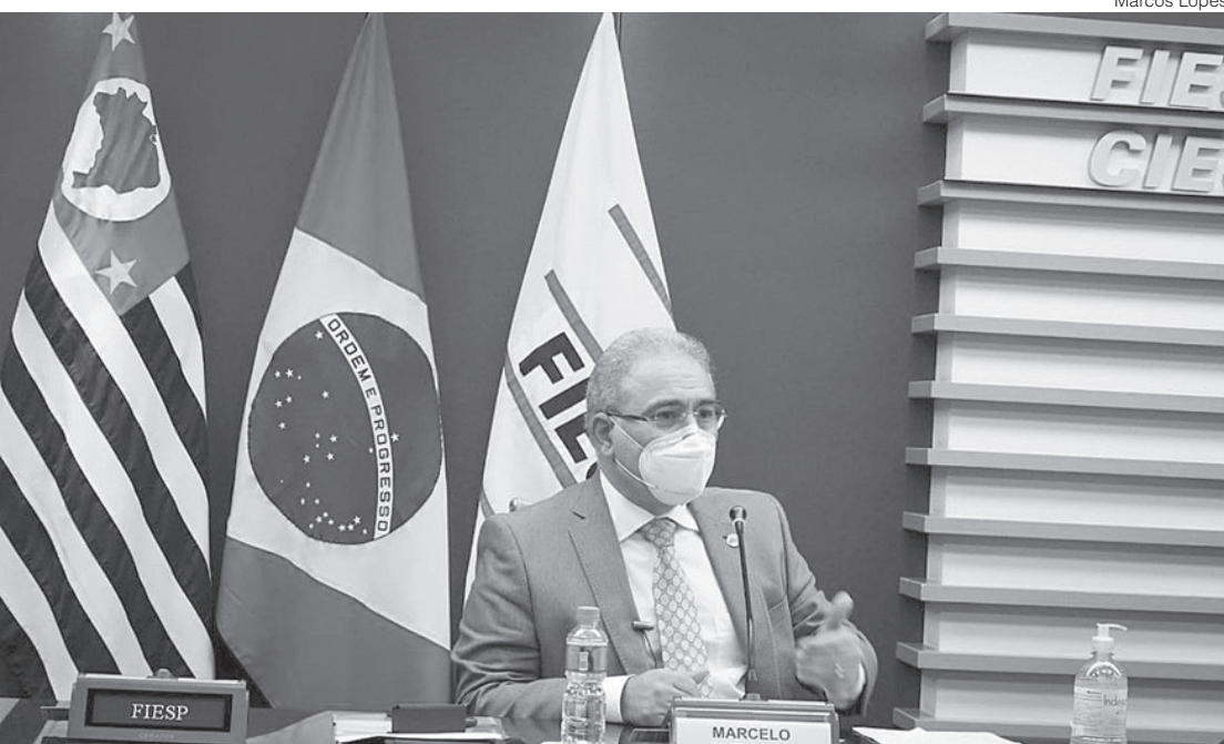
Declaração foi feita ontem durante encontro na Fiesp