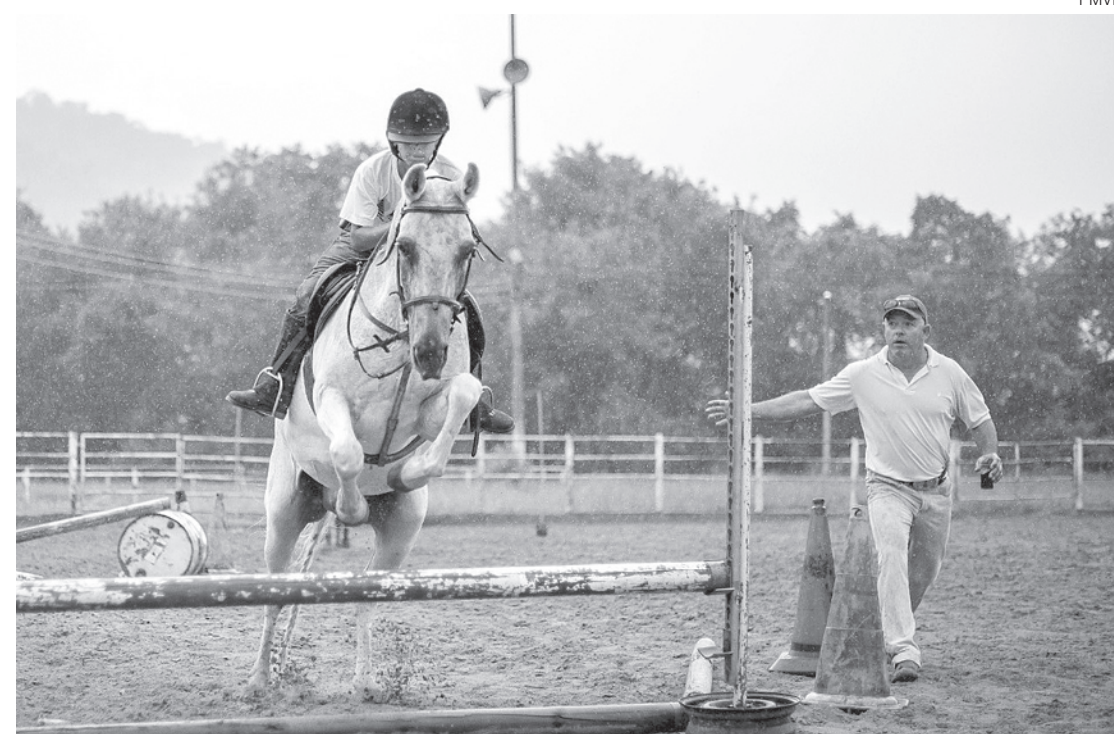
Projeto oferece aulas gratuitas a crianças matriculadas na rede municipal de ensino e havia sido interrompido pela gestão passada

Criada em 2003 pelo prefeito Antonio Francisco Neto, a Escola de Hipismo da Fundação Beatriz Gama é a única pública do Brasil. Ao longo deste tempo, mais de 1500 crianças passaram pela escola; e além de aprender, colecionaram títulos. A instituição é tetracampeã brasileira na categoria do Concurso de Escolas de Equitação (CEE) e eneacampeã estadual no ranking por escolas.