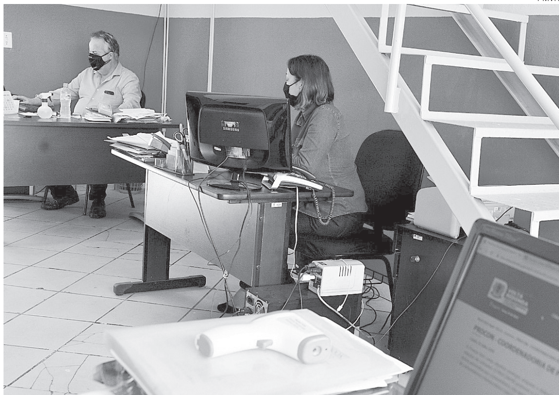
Programa tem registrado 12 reclamações por semana sobre o golpe

O Procon Volta Redonda fica na Rua Paulo Leopoldo Marçal, nº117, Aterrado. O horário de funcionamento é das 9h às 16h. Os telefones para contato são: 3339-9205 e 3339-9206.