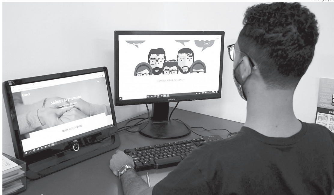
Curso pretende formar novos profissionais para fomentar economia local